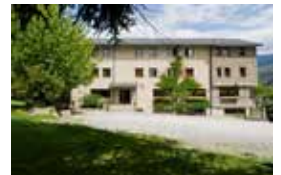
Casa de colònies L'Orri del Pallars