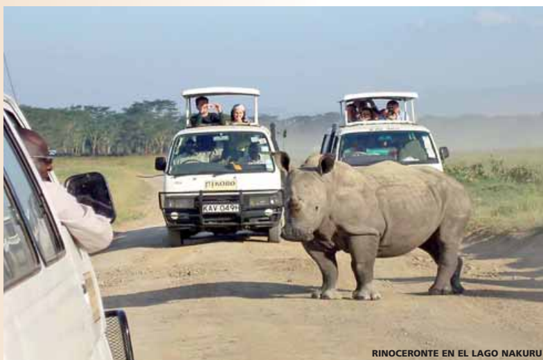
RINOCERONTE EN EL LAGO NAKURU

Extensión Playas Mauricio desde ... 1085 € (ver detalles en páginas 78 a 83)